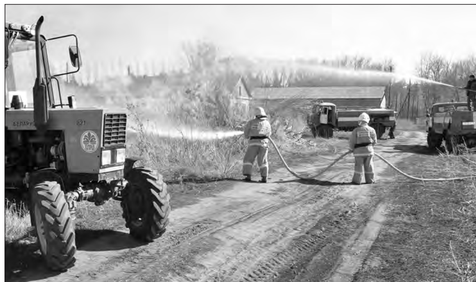
«Условный» огонь тоже не сдавался без боя