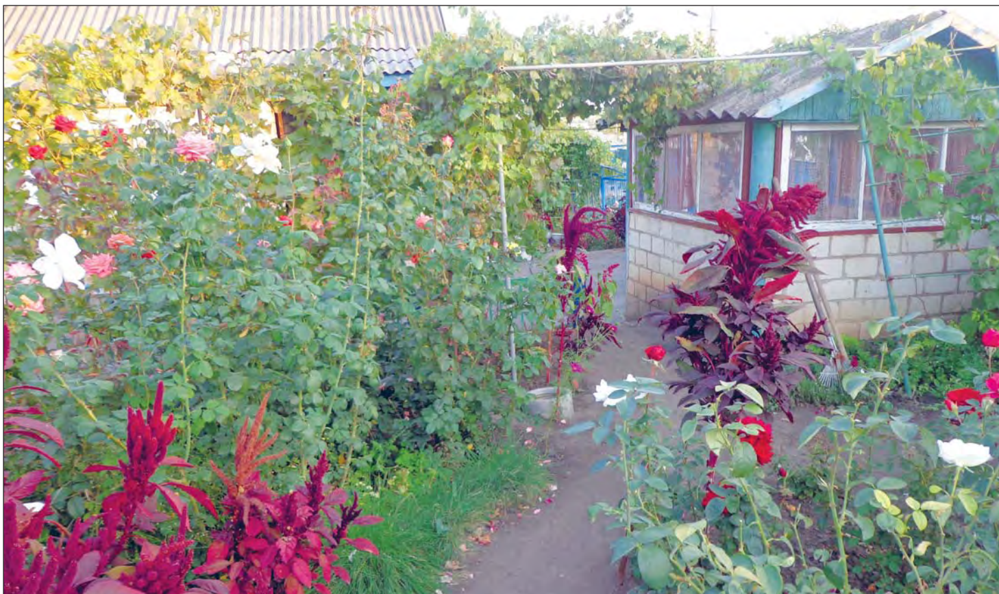
Подворье семьи Голубовых