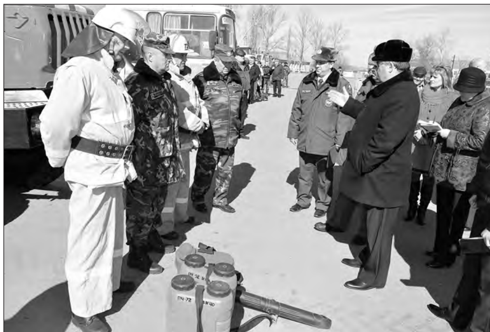
Противопожарные силы – на линейке готовности

Любовь ГЕРУСОВА