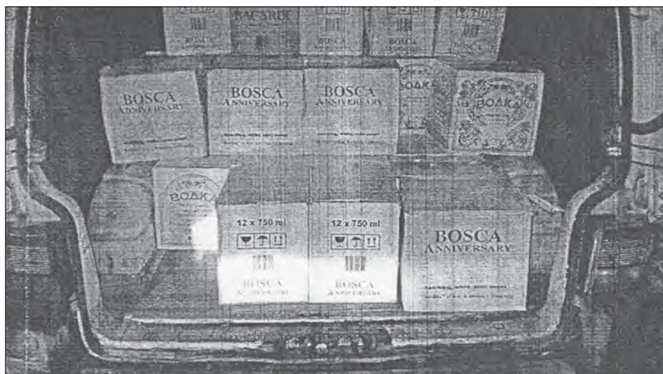
■ «Улов» богучарских оперативников.