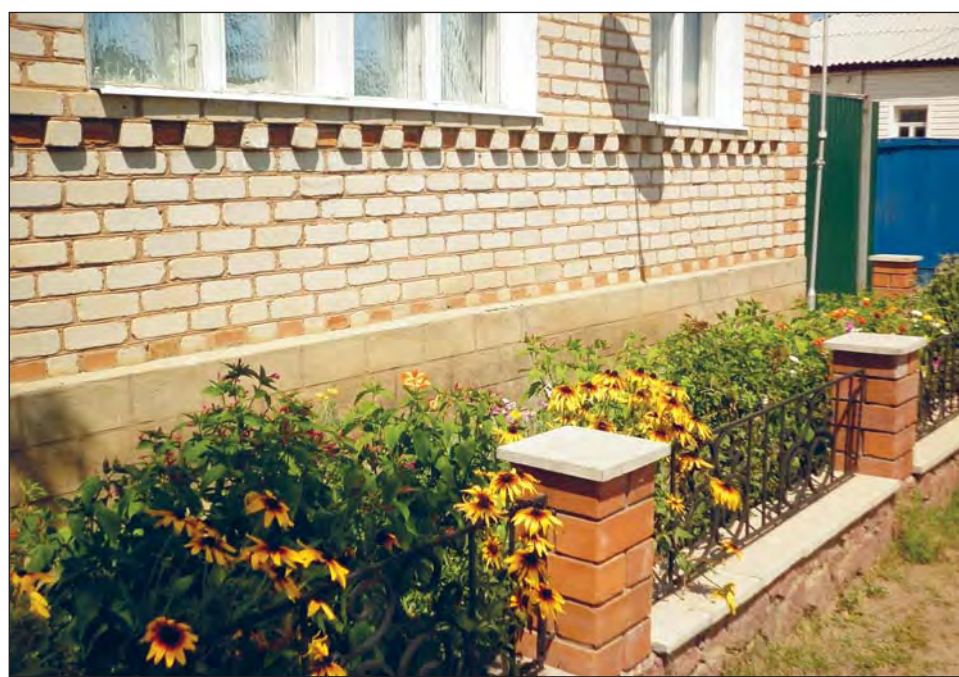
Подворье семьи Лахиных