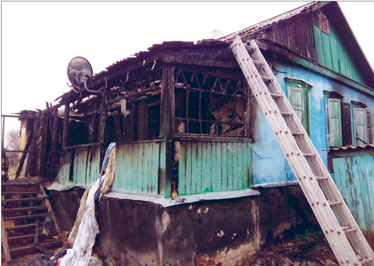
Дом, где произошла трагедия

Женщина с ребёнком отравились угарным газом